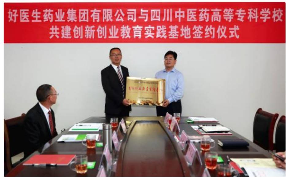
创新创业教育实践基地挂牌

7月3日，四川中医药高等专科学校与好医生药业集团有限公司共建创新创业教育实践基地签约挂牌仪式在凉山州布拖县举行。