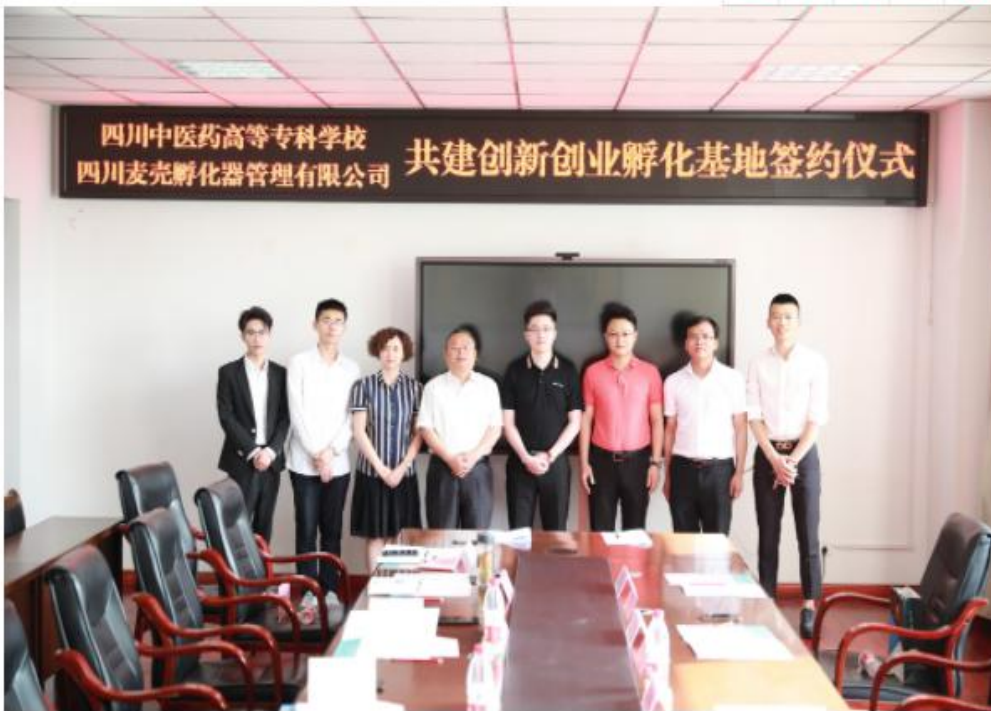
大学生医药健康创新创业孵化基地签约现场