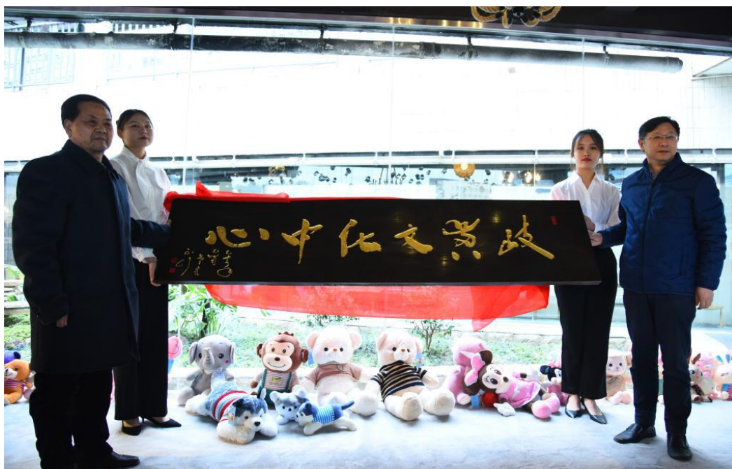
图为：岐黄文化中心挂牌