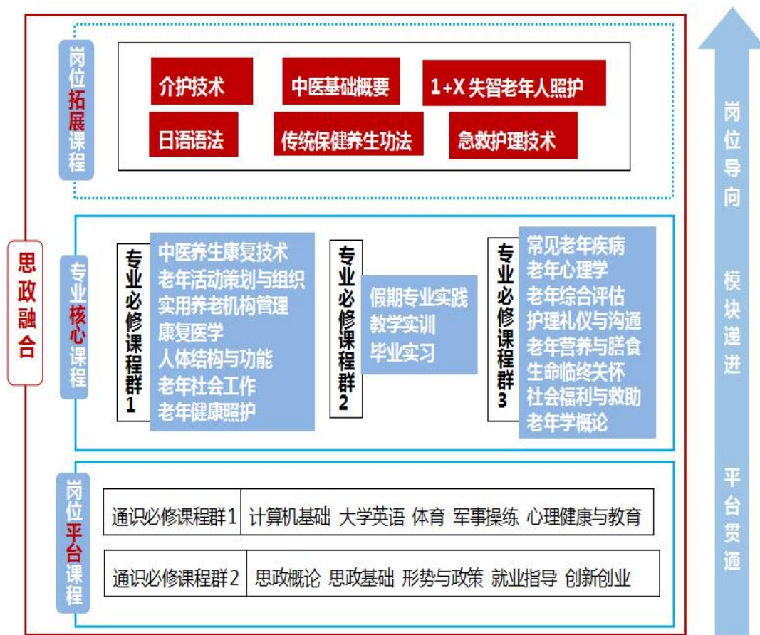
图2 “岗位导向、模块递进、平台贯通、思政融合”的课程体系

遵循医学高等职业教育的普遍规律与青年学生成长规律，系统设计形成了“岗位导向、模块递进、平台贯通、思政融合”的课程机构，实施“三教改革”。（见图2）