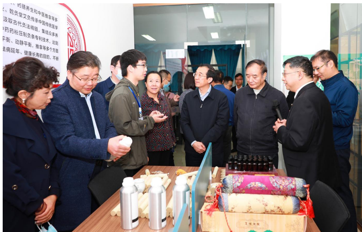
图为：2020年10月30日，全国人大常委会委员、农工党中央专职副主席杨震率农工党中央调研组到我校双创实践基地调研并高度评价了学校创新创业教育举措和取得的成绩。