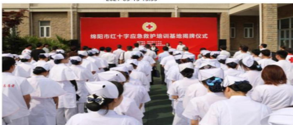
图为:揭牌仪式现场