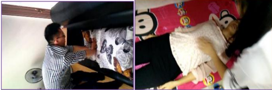
2013、2014 级学生普及急救技能视频截图