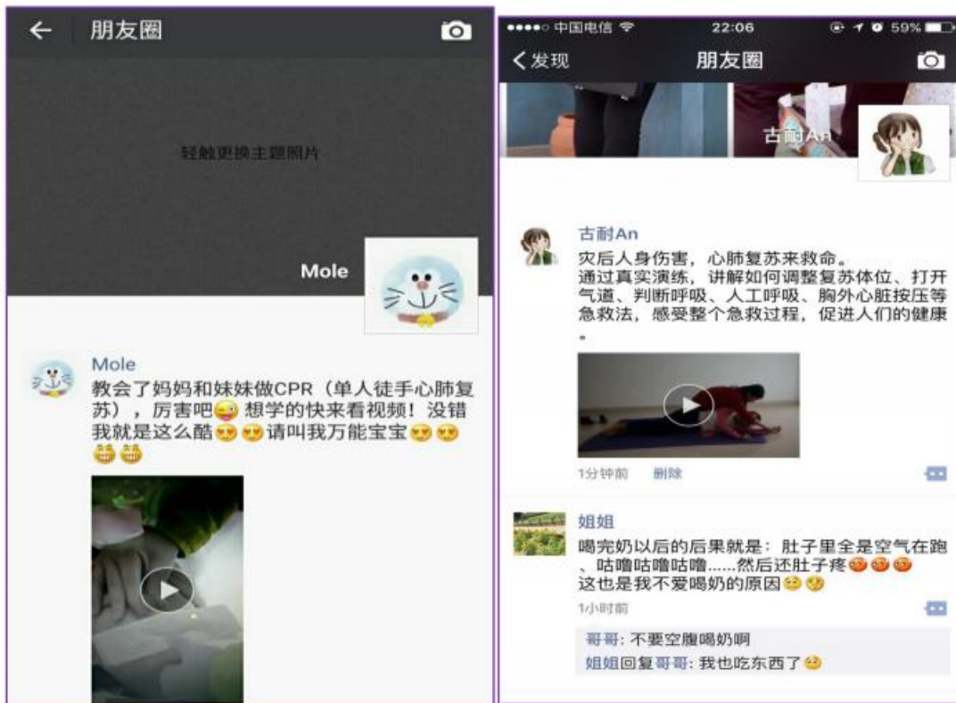
2015 级学生普及急救技能视频发朋友圈